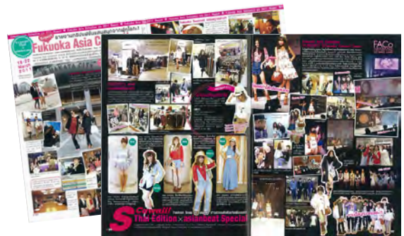
タイ版 S Cawaii !