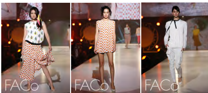
FACo 2011 アジアステージ (韓国)

韓国のデザイナーが作るファッションブランドを招聘します。 (参加ブランドは現在調整中)