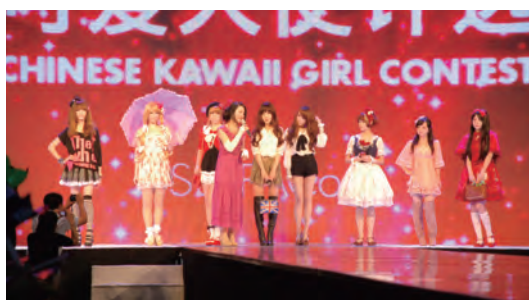
FACo in 大連でのカワイイコンテストの様様

中国(S Cawaii !)、タイ(S Cawaii !)、台湾(GLAMOROUS)の現地ファッション誌で活躍する人気モデルがFACoのランウェイに登場し、FACoのイベントレポートがアジア各地に発信されます。